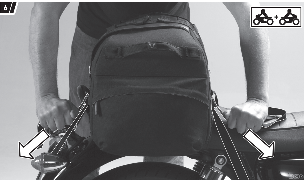
Befestigung und Fahrzeug dienen als Beispiel. / Fixation and vehicle are examples.

Ziehen Sie die Befestigungsgurte (2) an, bis die Hecktasche (1) zentriert und fest auf dem Soziusplatz sitzt. Überprüfen Sie den festen Sitz.