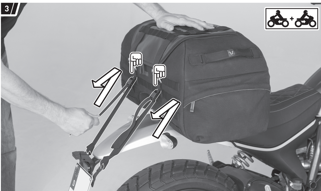
Befestigung und Fahrzeug dienen als Beispiel. / Fixation and vehicle are examples.

On both sides entangle two straps (2) to appropriate and reliable attachment points at the rear of the vehicle (as described in step 1).