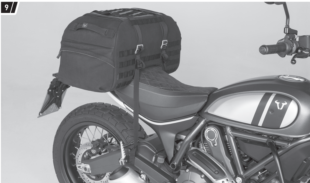
Befestigung und Fahrzeug dienen als Beispiel. / Fixation and vehicle are examples.

FUNKTIONSKONTROLLE: Achten Sie nach der Befestigung darauf, dass keine Komponente des Produkts mit heißen und beweglichen Teilen des Fahrzeugs in Berührung kommen kann. Achten Sie desweiteren darauf, dass alle Komponenten mindestens 5 cm Abstand zu heißen Teilen sowie dem heißen Abgasstrom des Auspuffs haben. Federn Sie zu diesem Zweck nach erfolgter Montage das Fahrzeug mehrere Male im Stand voll durch.