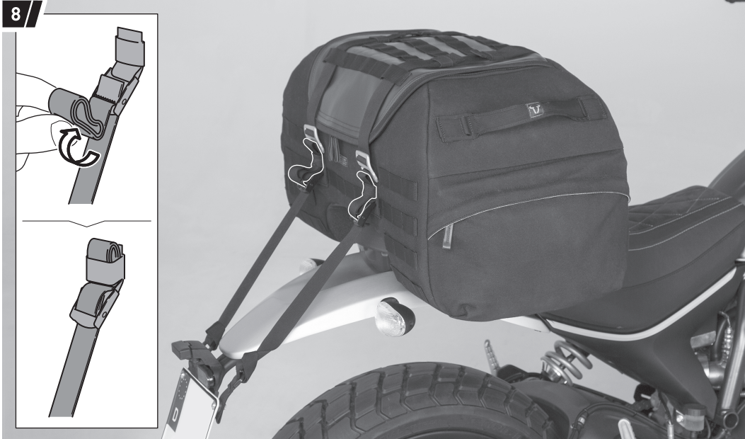
Befestigung und Fahrzeug dienen als Beispiel. / Fixation and vehicle are examples.

ACHTUNG: Achten Sie nach dem Verzurren der Hecktasche (1) darauf, dass die Überlängen der Befestigungsgurte (2) gegen Flattern gesichert werden, wie in der Detailzeichnung gezeigt.