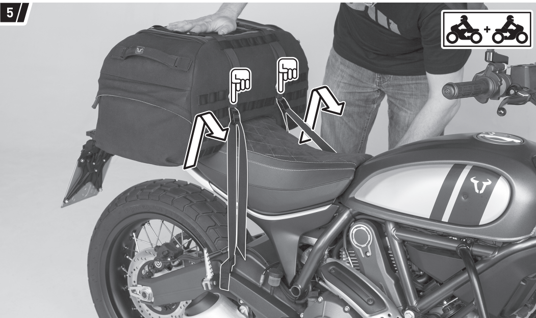
Befestigung und Fahrzeug dienen als Beispiel. / Fixation and vehicle are examples.

Ziehen Sie die Befestigungsgurte (2) beidseitig durch die in der Abbildung markierten Schnallen der Hecktasche (1).