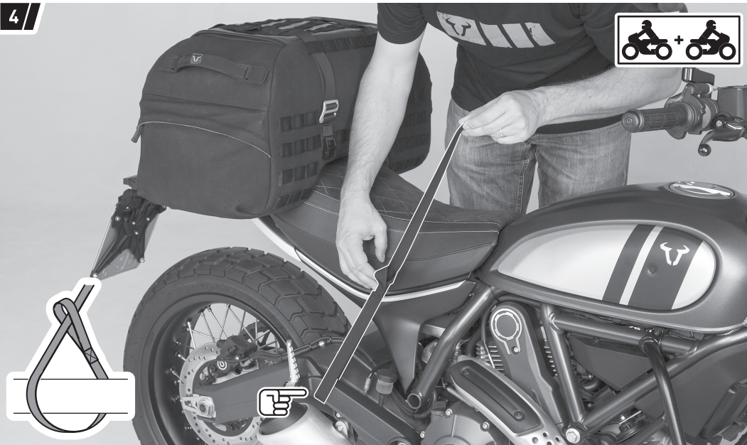
Befestigung und Fahrzeug dienen als Beispiel. / Fixation and vehicle are examples.

Verschlaufen Sie zwei Befestigungsgurte (2) beidseitig an geeigneten und belastbaren Befestigungspunkten des Fahrzeugs (z. B. Soziusfußrastenhalterung, Fahrzeugrahmen etc.).