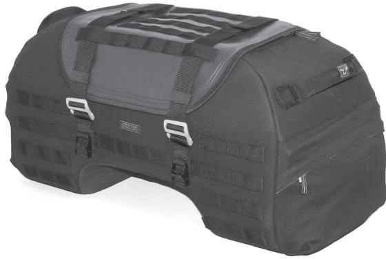
1 1x Hecktasche LR2 Tail Bag LR2