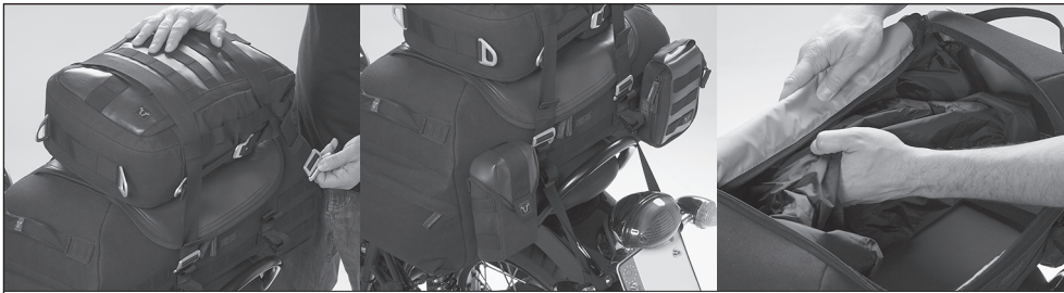
Features (von links nach rechts): Befestigungsgurte; Anbringungsmöglichkeit von zusätzlichem Gepäck; Wasserdichte Innentasche mit Klettbefestigung. Features (from left to right): Mounting straps; Attaching possibility for additional luggage; Waterproof innerbag with Velcro fixation.