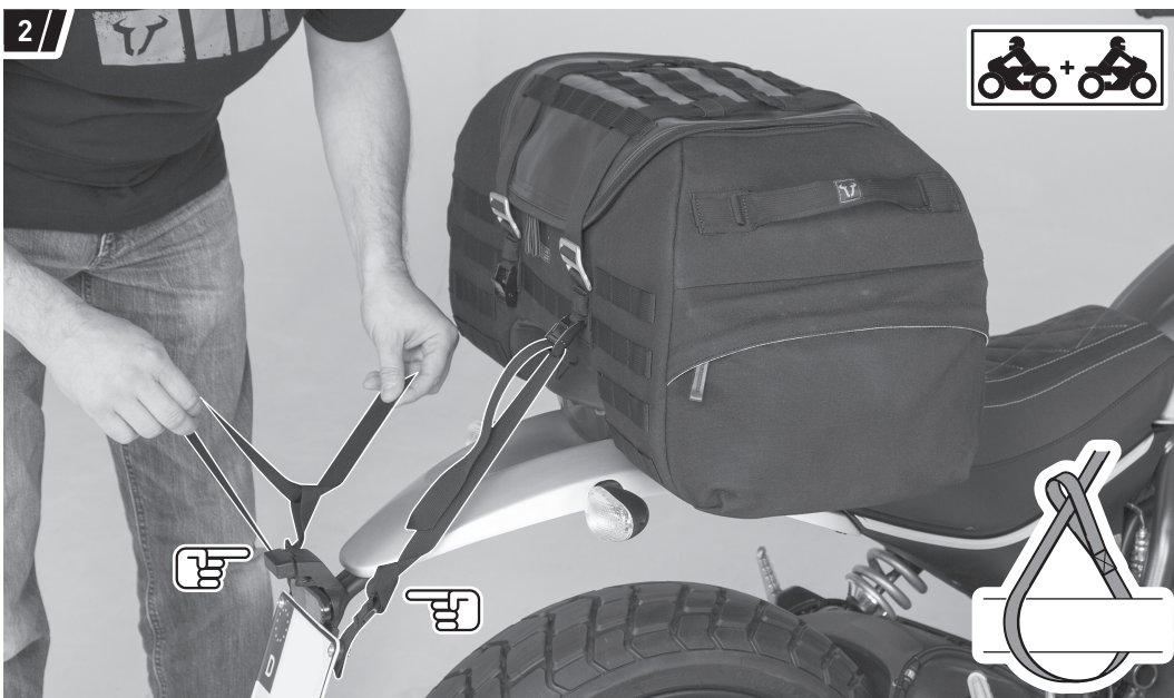
Befestigung und Fahrzeug dienen als Beispiel. / Fixation and vehicle are examples.

Alternatively, the straps (2) can get entangled under the fender.