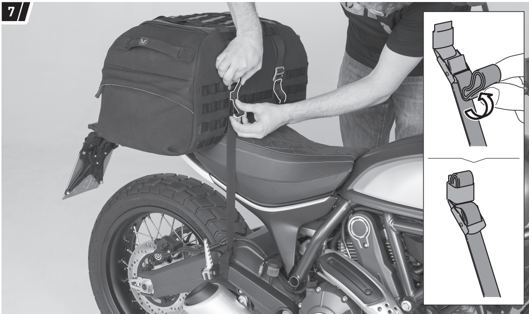
Befestigung und Fahrzeug dienen als Beispiel. / Fixation and vehicle are examples.

ACHTUNG: Achten Sie nach dem Verzurren der Hecktasche (1) darauf, dass die Überlängen der Befestigungsgurte (2) gegen Flattern gesichert werden, wie in der Detailzeichnung gezeigt.